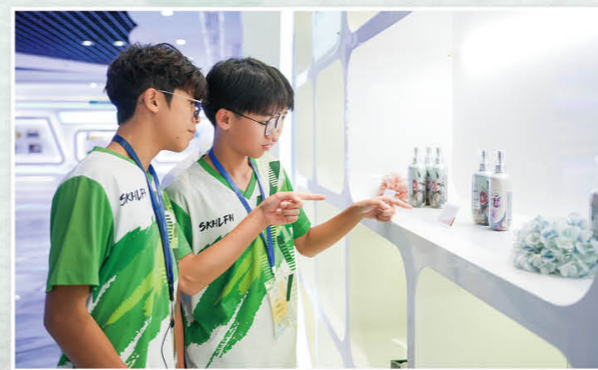
「高铁短线行——厦门创新及科技产业与升学就业探索之旅」学习交流团