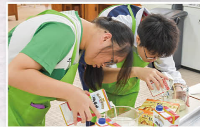
职业体验证书课程