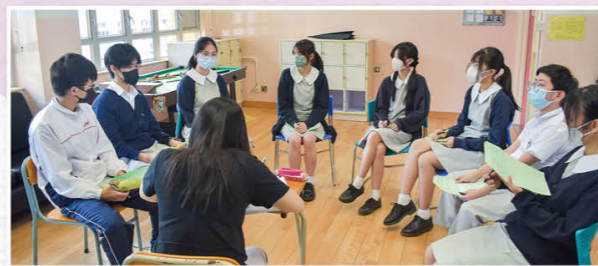
模拟放榜活动，中六生投入专注。

竞技赛」、「亲子摄影比赛」、「父母亲节鲜花敬赠活动」、「创意小盆栽及烫印环保袋工作坊」、「制作利是封挂饰及传统小食工作坊」、「校园·好精神」之「家长也敬师运动」等；家教会又为中六学生送上刻有鼓励字句的匙扣为他们打气、设立各级中、英、数、生活与社会/公民与社会之优异奖及进步奖奖学金、与视觉艺术科合办「家教会会徽设计比赛」、与历史科「LFH游学学会」合办「食游世界·长知识」，积极支持学生不同领域的学习发展。透过一系列温馨的活动，亲子关系得到升华，家校关系亦越见珍贵。