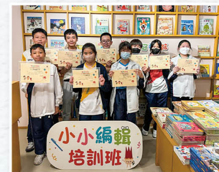
编辑培训班，当个小小编辑家。