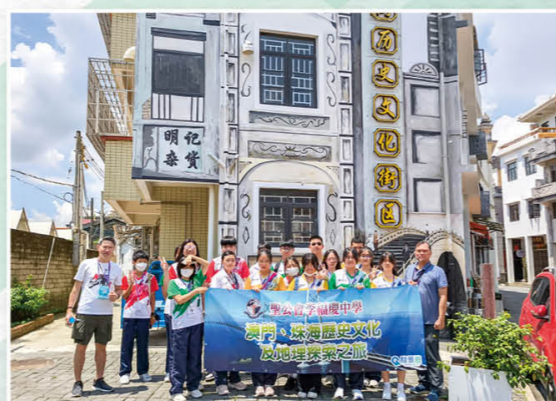
澳門、珠海历史文化及地理探索之旅