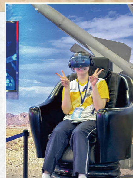
趣味虚拟实境体验