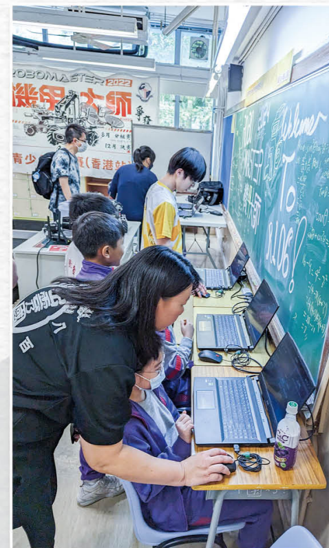
东区机甲大师分区挑战赛——小学生培训工作坊