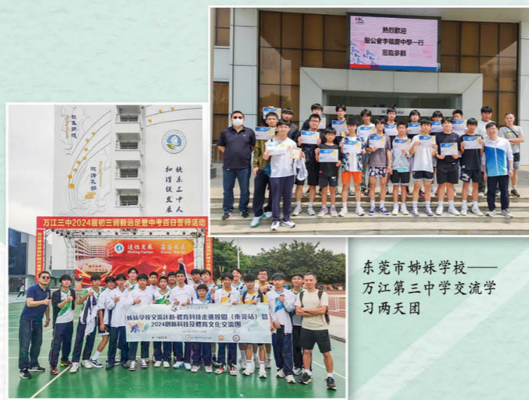
东莞市姊妹学校—— 万江第三中学交流学习 两天团

术探索交流团」、「厦门创新及科技产业与升学就业探索交流团」、「历史地理大湾区考察交流团」、「珠海航空科技内地考察」等，让学生开阔的视野，让他们更全面认识祖国，培养家国情怀，并珍视中华文化。