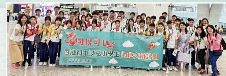
同根同心——韶关丹霞山地质地貌及生态保育交流团