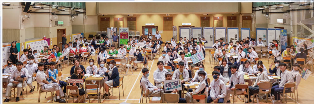
生涯财策划家，积极参与捋满分。