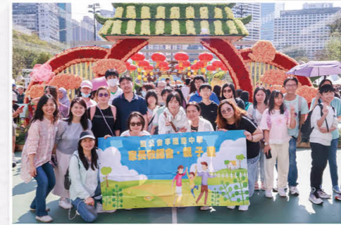
家校亲子旅行，温情满载笑颜展。