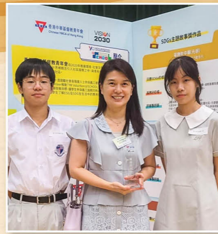
「YM Volunteer@school」奖励计划—— 义务工作积极参与奖