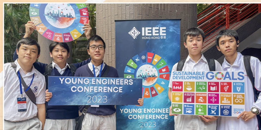
Young Engineers Conference 2023 Credit Award