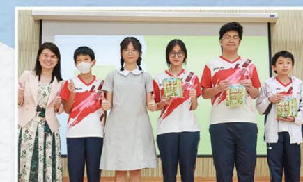
初中社际数学比赛