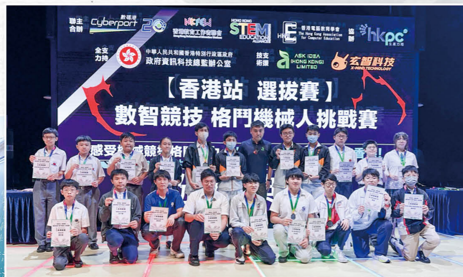
数智竞技——格斗机器人挑战赛(香港站)