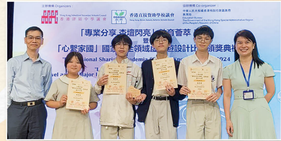
国家安全领域——虚拟游戏设计比赛