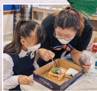
「创意小盆栽工作坊」