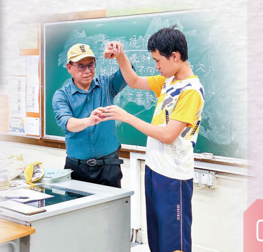
职业体验证书课程，多才多艺展天赋。