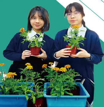
公益金慈善 花卉义卖