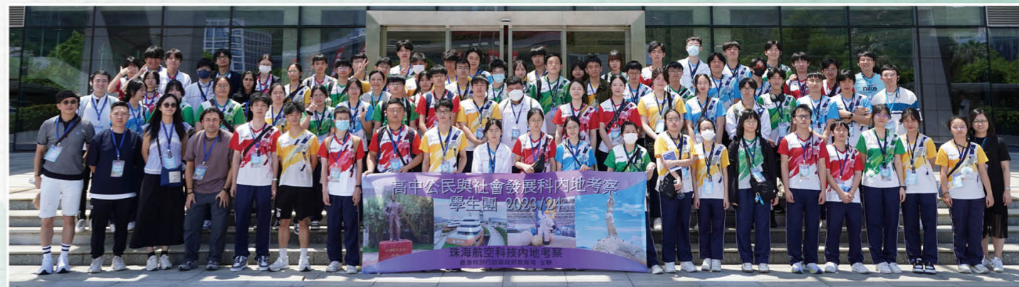
公民与社会发展科内地考察活动