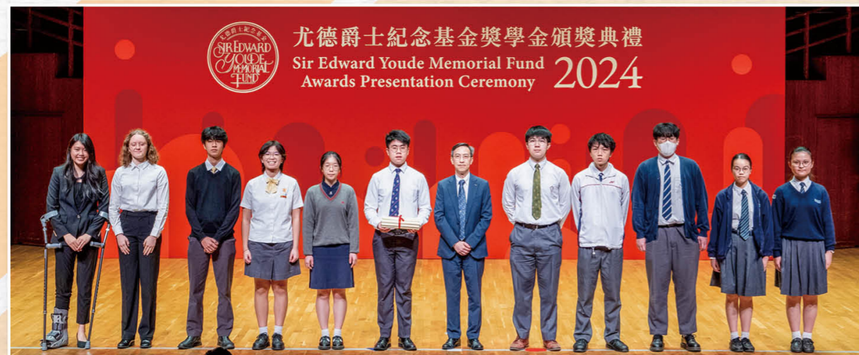
尤德爵士纪念奖学金——高中学生奖