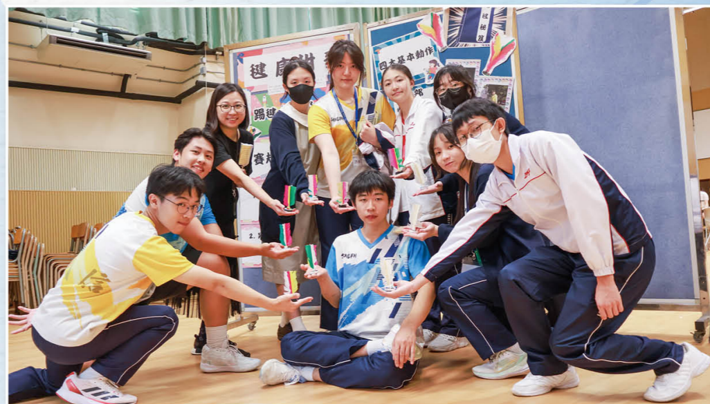
文商周「健康甜麦·踢毽大比拼」