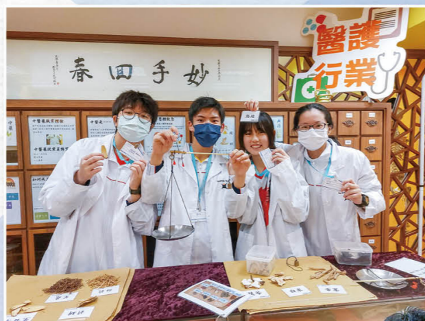
职业体验课程，认识各行各业。

在教师专业发展方面，本校持续为教师提供不同的专业培训课程，并建立共同备课、同侪观课、公开课及评课文化，各科亦持续深化电子教学策略。本校又参加「赛马会『校本多元』计划」，透过计划善用学生数据平台、适异教学策略及学生支援等，提升教师照顾学生多样性的专业性。