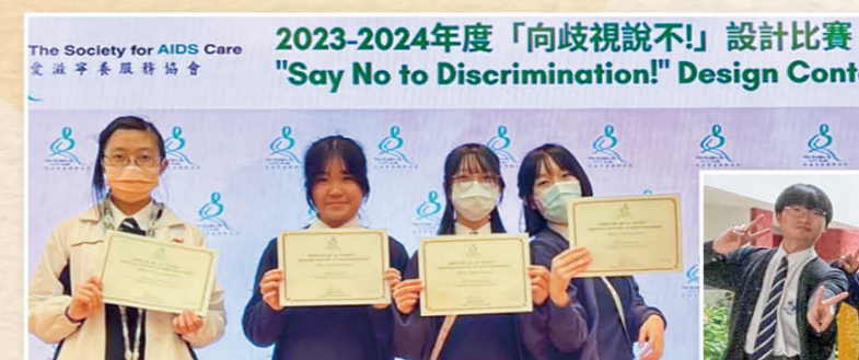
「向歧视说不！」——面具设计比赛2023