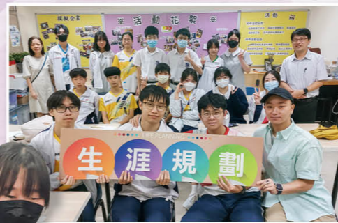
生涯规划至重要，我要当个小老板。