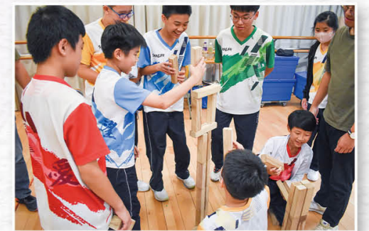
中一健康教育日营，团队合力困难解。