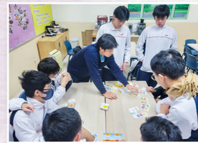
赛马会动·听心灵计划，狗狗牵动众爱心。