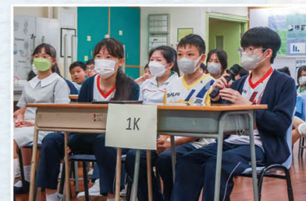
阅读问答比赛，漫游古人诗词世界。