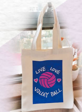
「烫印环保袋工作坊」，共绘亲子专属记忆。