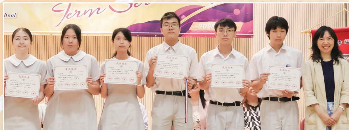
「菁英杯」现场作文比赛总决赛