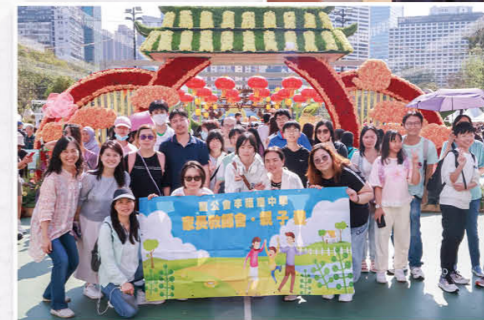
家校親子旅行，溫情滿載笑顏展。