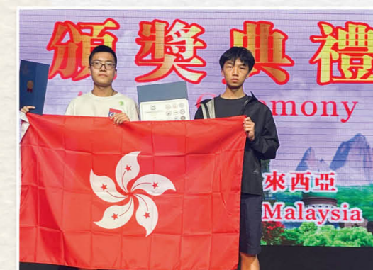
2023年度亞洲國際數學奧林匹克公開賽及世界數學遊戲公開賽獎項