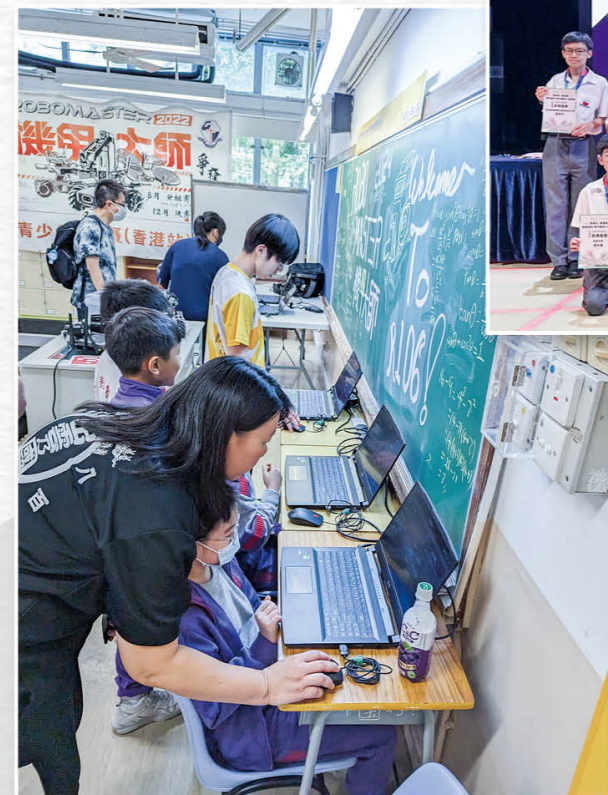
東區機甲大師分區挑戰賽——小學生培訓工作坊