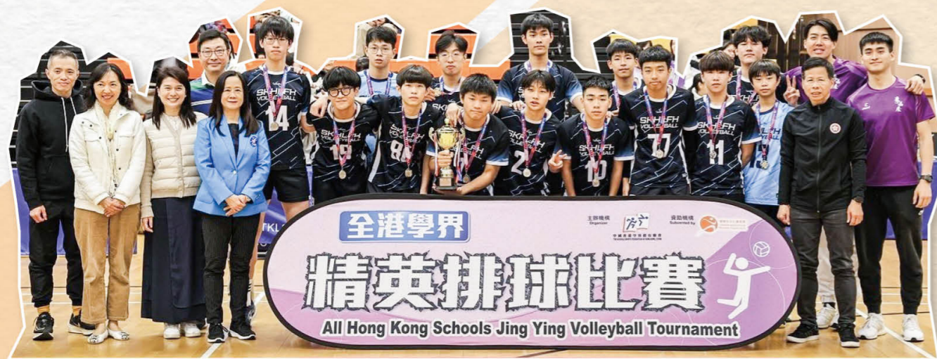
全港學界精英排球比賽(男子組)——亞軍