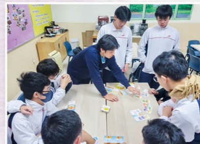
賽馬會動·聽身心靈計劃，狗狗牽動眾愛心。