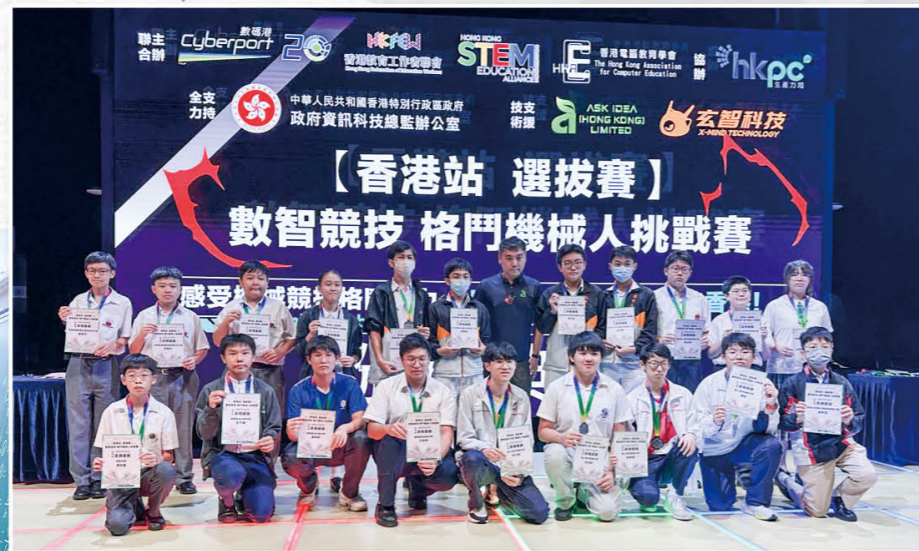
數智競技——格鬥機械人挑選賽(香港站)