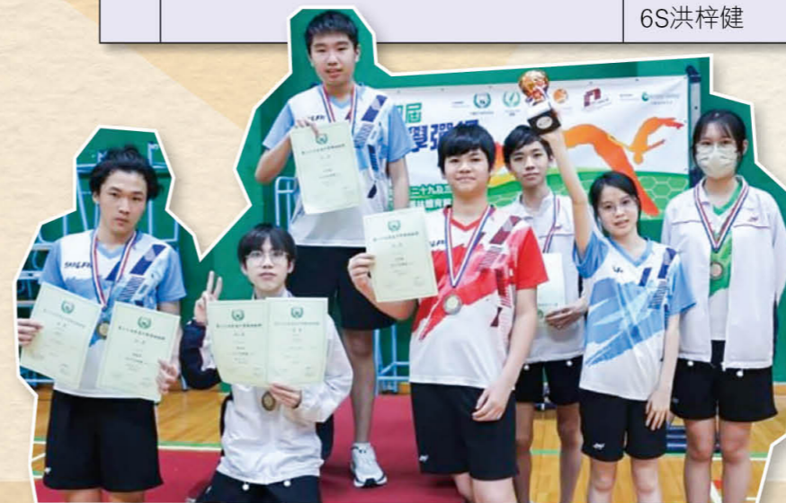
香港中學彈網錦標賽——男子甲組團體季軍