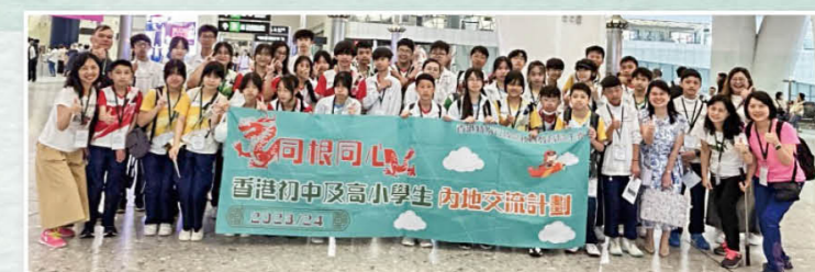
同根同心——韶關丹霞山地質地貌及生態保育交流團