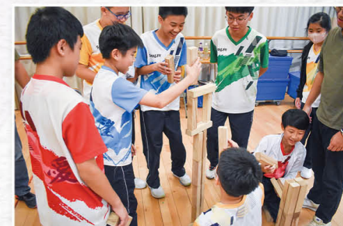
中一健康教育日營，團隊合力困難解。