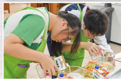
職業體驗證書課程