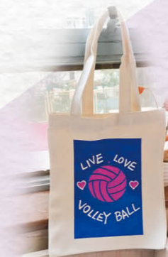
「燙印環保袋工作坊」，共繪親子專屬記憶。