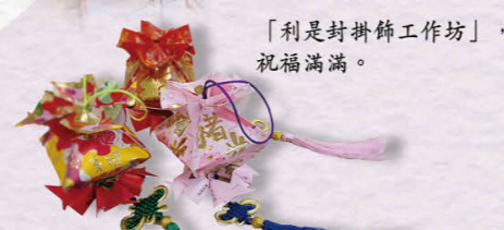
「利是封掛飾工作坊」，祝福滿滿。