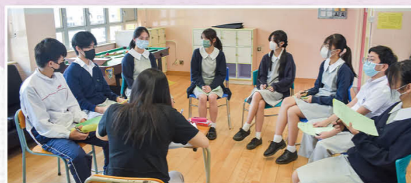
模擬放榜活動，中六生投入專注。

競技賽」、「親子攝影比賽」、「父母親節鮮花敬贈活動」、「創意小盆栽及燙印環保袋工作坊」、「製作利是封掛飾及傳統小食工作坊」、「校園·好精神」之「家長也敬師運動」等；家教會又為中六學生送上刻有鼓勵字句的匙扣為他們打氣、設立各級中、英、數、生活與社會/公民與社會之優異獎及進步獎獎學金、與視覺藝術科合辦「家教會會徽設計比賽」、與歷史科「LFH遊學學會」合辦「食遊世界·長知識」，積極支持學生不同領域的學習發展。透過一系列溫馨的活動，親子關係得到昇華，家校關係亦越見珍貴。