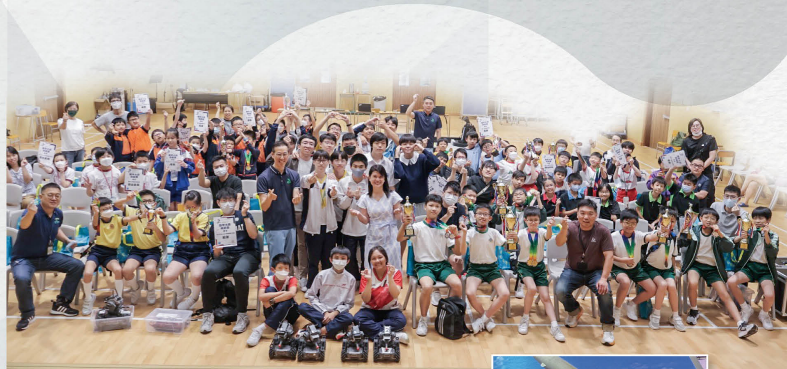
東區機甲大師分區挑戰賽

為培養學生對創新科技的興趣，本校致力於打造優質的數碼學習環境。除了連續五年獲教育局邀請，成為全港14所資訊科技教育卓越中心之一，本校亦通過政府資訊科技總監辦公室「中學IT創新實驗室」計劃的撥款，持續優化教學設備。同時，本校亦積極推動電子教學，榮獲Google Education認可成為「Google Reference School」，老師善用各種線上平台如Kami、Quizziz、Pear Deck等，提供多元化的數碼學習環境，同時提升學生的互動學習體驗。