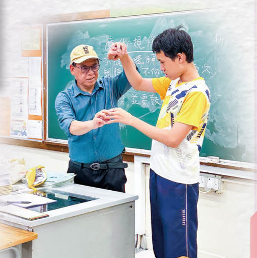
職業體驗證書課程，多才多藝展天賦。