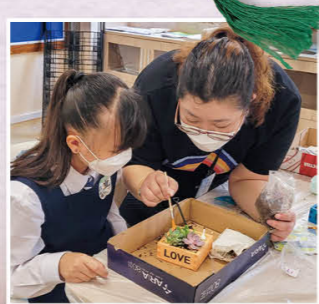
「創意小盆栽工作坊」