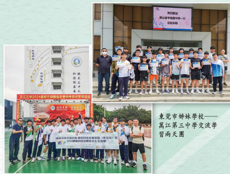
東莞市姊妹學校—— 萬江第三中學交流學習兩天團

術探索交流團」、「廈門創新及科技產業與升學就業探索交流團」、「歷史地理大灣區考察交流團」、「珠海航空科技內地考察」等，讓學生拓闊的視野，讓他們更全面認識祖國，培養家國情懷，並珍視中華文化。