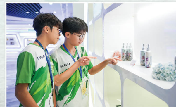
「高鐵短線行——廈門創新及科技產業與升學就業探索之旅」學習交流團