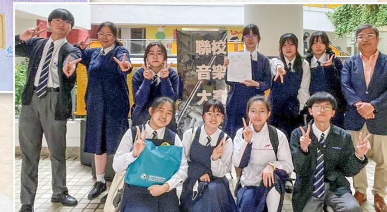
香港聯校音樂大賽2024——手鈴及手鐘(中學組)金獎