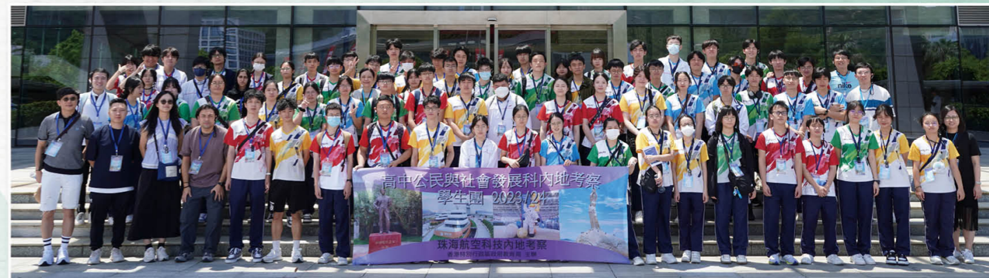
公民與社會發展科內地考察活動