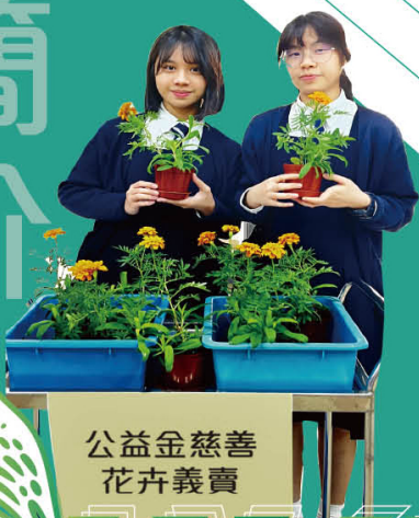
公益金慈善 花卉義賣