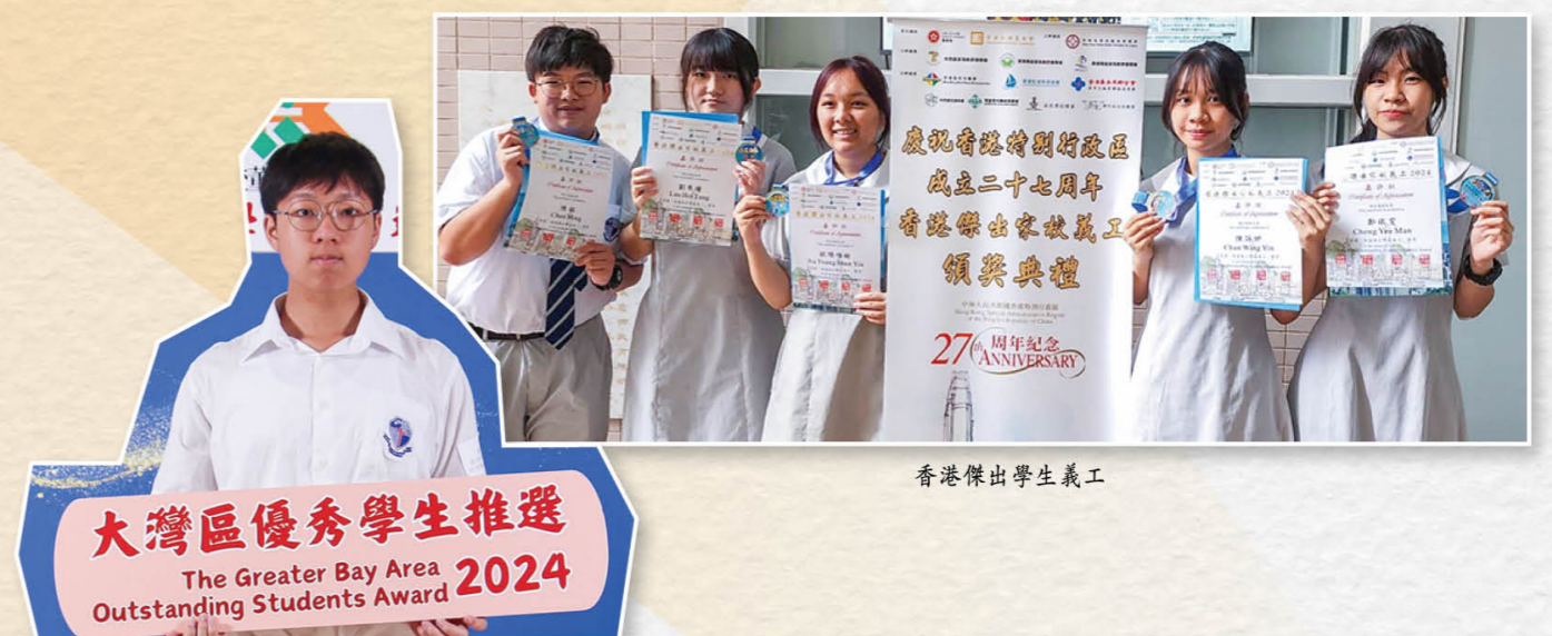
香港傑出學生義工

大灣區優秀學生推選 The Greater Bay Area Outstanding Students Award 2024