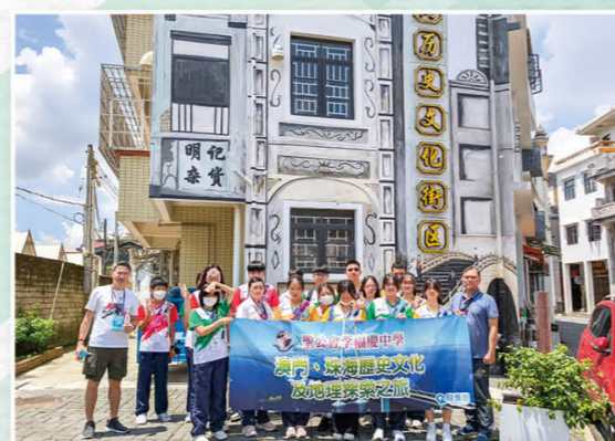
澳門、珠海歷史文化及地理探索之旅