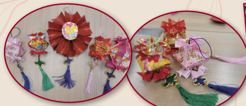
「身體健康」是對每個人最大的祝福呢！