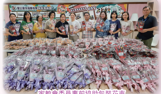
家教會委員事前協助包裝花束