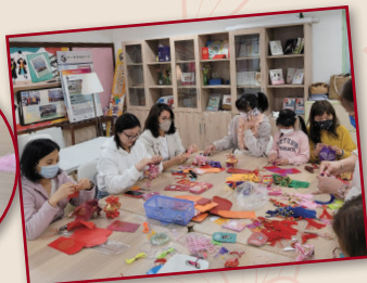
家長們正在精心製作賀年掛飾