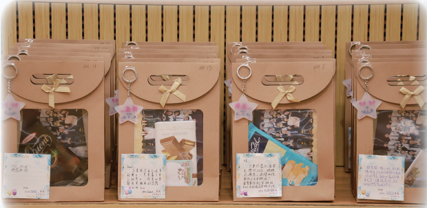
中六學生家長親手寫下心意卡，加上家教會精心製作的打氣包，為同學注入滿滿的作戰動力。

家教會不僅致力於促進家校溝通，也積極支持學生在不同領域的學習發展。本會於香港中學文憑考試 (DSE) 前夕，向中六學生送上刻有鼓勵字句的鑰匙扣為他們打氣，祝願他們取得理想成績，努力追尋自己的夢想。