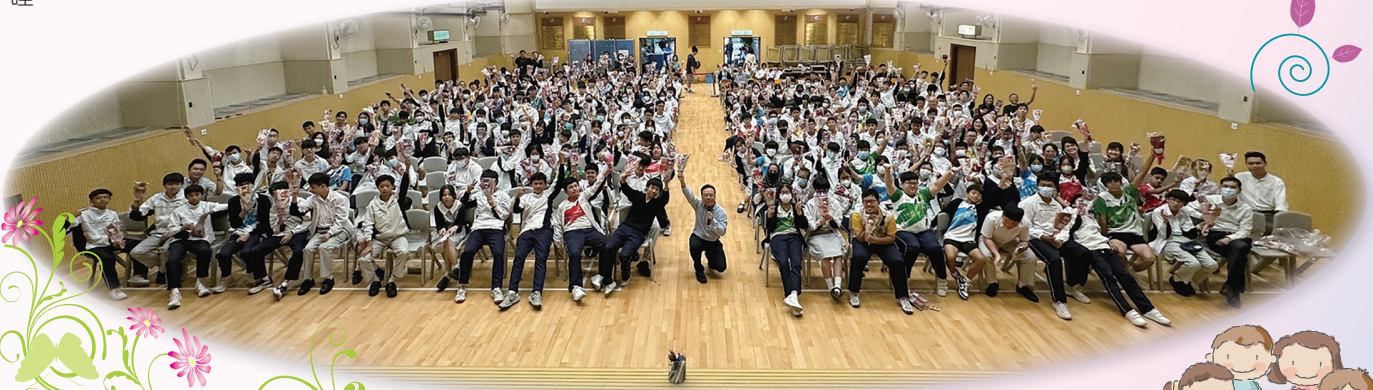
同學收到家教會預備的花束，便可在父母親節送給家長。