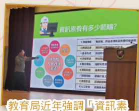
教育局近年強調「資訊素養」九大範疇