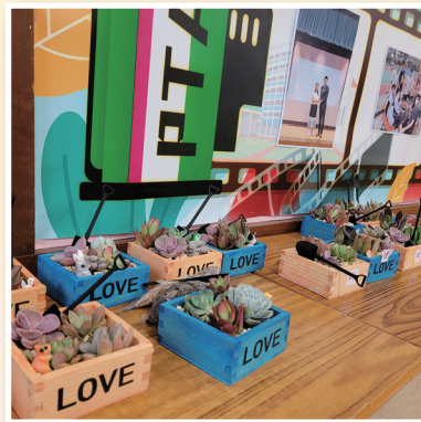
各式各樣的小盆栽充分展現了參加者的創意

這次開放日活動不僅讓孩子們發揮創意，學習手作技能，還促進了家長和學校的互動和交流。通過親子手工坊的活動，家長們能更深入地了解孩子的學習狀況和興趣，並與教師們進行交流。整個活動過程中，歡笑聲不斷，家長和孩子互相合作，一起創作出了許多獨特的作品。每個家庭都愉快地參與其中，留下了許多珍貴的回憶和活動花絮。