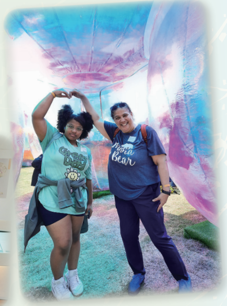
一個手勢，勝過千言萬語。