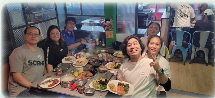
美味的食物、愉快地閒聊，大家享用了一頓舒適又愜意的午餐。