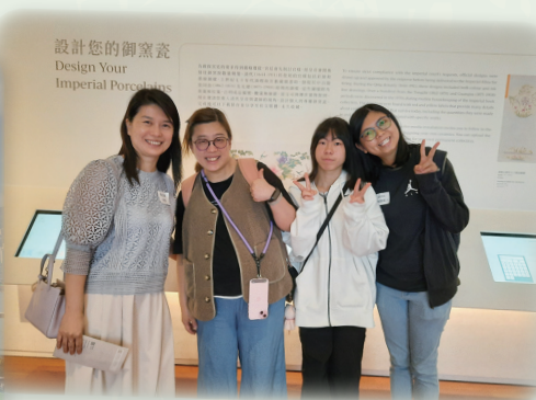
欣賞文物之餘，更珍貴的是共聚交流的時光。