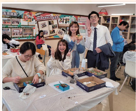
老師們也把握機會，製作出自己心愛的小盆栽。