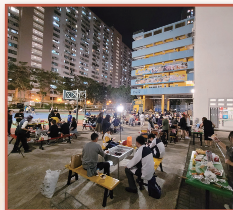
夜幕低垂，更為活動增添了不少氣氛。

燒烤晚會的氣氛熱烈而充滿活力，孩子們非常開心，與他們的家人以及同學們都玩得盡興。藉着這次美好的經驗，家長和孩子們能暫時忘卻生活的不快、放下電子產品、共享天倫之樂，增進了他們彼此之間的感情。我們相信，這樣的活動對於家庭和社會都是有益的。