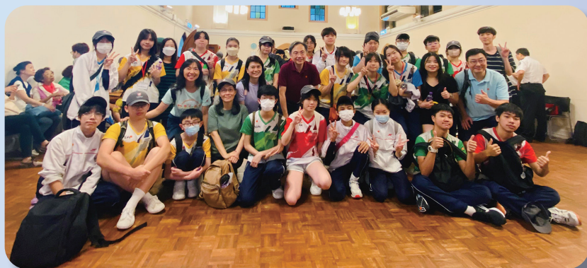
吳校長與一眾師生參與聖約翰座堂步行籌款活動

在此，再次感謝家長們的信任和支持，本校誠願繼續保持「家校合一、彼此互信」的關係，透過家校攜手的力量，培育我們每一位獨特的孩子，讓他們在社會中發光發熱，展現亮點！