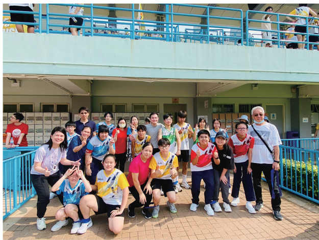
既能競技，又能籌款幫助長者，實在是別具意義。