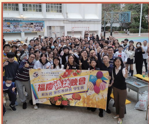
燒烤晚會是本校每年令人期待萬分的盛事