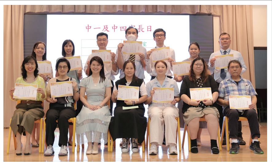
第二十二屆家長教師會委員合照

其後，家教會會員表決通過第二十一屆家長教師會會務報告、財務報告及第二十二屆家長教師會常務委員會委員名單。最後是中一及中四家長會，家長到課室與班主任會面，班主任介紹班中活動及反映學生情況，互相交流。在此，多謝各位家長支持家教會及學校工作，我們會繼續推動家校合作，讓我們的孩子有充實而愉快的校園生活。