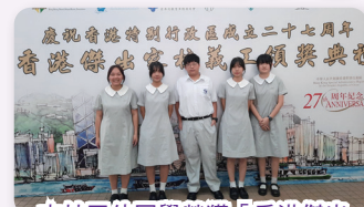
本校五位同學榮獲「香港傑出學生義工」獎

由香港區家長教師會聯會，以及多區校長聯會、家長教師會攜手合辦「第五屆香港傑出家校義工選舉」頒獎典禮已於7月1日舉行。是次活動獲港島區超過150間中、小學及幼稚園參與，超過1000名教師、家長及學生獲得嘉許。