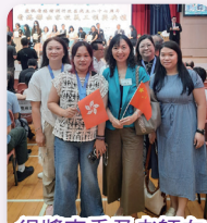
得獎家委及老師在會場合照