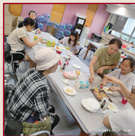
家長一邊製作小食，一邊交流子女的校園點滴。