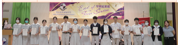
中、英、數及公民科優異獎領獎生