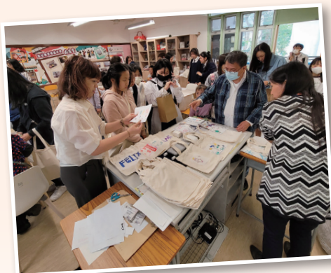
燙印環保袋亦深受歡迎