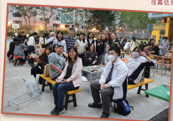
燒烤晚會凝聚了不同年級的學生和家長