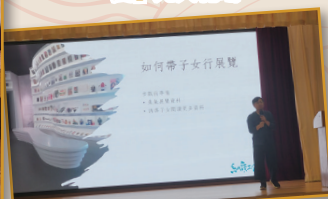
張穎恒先生跟家長分享與子女遊博物館的心得