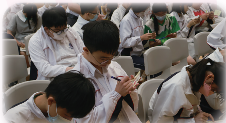
心意卡上記載的，是同學對父母的由衷謝意。

為答謝父母養育的深恩，本校沿襲優良傳統，家教會及學生會於5月10日合辦「父母親節鮮花敬贈活動」。一眾家教會成員、學生會成員和老師們更是不遺餘力地完成任務，讓學生可將花束和心意卡於父母親節敬贈父母，並向他們表達謝意，為這重要節日增添一點溫情暖意。祝福每個家庭都恩典滿滿，幸福和睦。