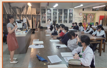
視藝科老師向同學簡介創作要求

家教會與視藝學會於本年度4-5月合辦了一個「家教會會徽設計比賽」，公開向全校同學徵稿。為了令同學明白是次比賽的評審要求及準則，視藝科老師特意舉辦了一次簡介會，引導同學思考家長教師會的理念，以及如何在會徽中呈現本校特色。在評賞不同文化背景的標誌時，老師同時引導同學關注設計實用性的問題。在老師的帶領下，同學們運用padlet軟件，以同儕協作的形式製作腦圖及即時做圖片搜集和討論，協助同學發展創作意念。