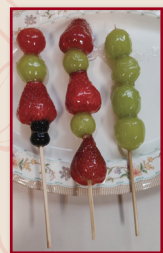
以水果製成一串串冰糖葫蘆，令人食指大動。