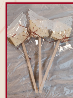
麥芽餅是不少人的童年回憶

承接第一次茶聚及工作坊，這次聚會的主題是製作傳統小食——冰糖葫蘆和麥芽餅。雖然製作步驟簡易，但也講求耐心，家長們一邊聊天，一邊製作小食，非常投入。工作坊後，大家都分享製成品及子女的校園點滴，十分愉快，希望來年教會能舉辦更多促進家長交流、有益身心的活動。