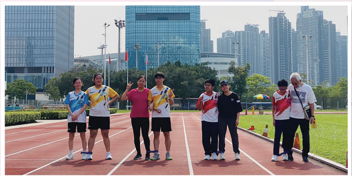
比賽健兒起步前合照

一如以往，本年度陸運會除了有非常激烈的田徑比賽外，家教會連同社會服務組舉辦了「親子師生慈善競技賽」。當日不少學生連同家長、老師、同學共同在運動場上完成二人三足的競技，此賽事同時為「香港平安鐘協會有限公司」籌款。是次活動共籌得港幣$5552，當中籌得款項最多的班別為5S班。今次活動既可以享受競技的樂趣，亦可以籌款回饋社會，一舉兩得！