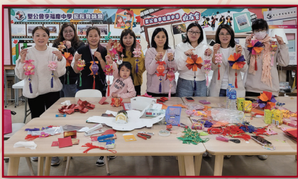
掛飾代表着對新一年美好生活的祝願

最後，我們要衷心感謝所有家長們的參與和支持！沒有你們的熱情參與，這次活動不會如此成功。希望未來我們可以繼續攜手合作，為孩子們創造更美好的學習環境。謝謝大家！