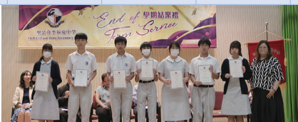
數學科及公民與社會發展科進步獎領獎生