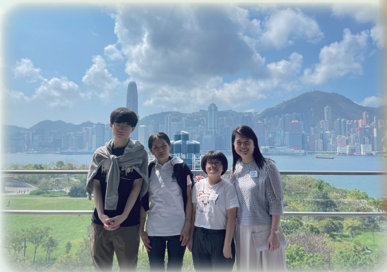
維港風景美不勝收，令人心曠神怡。

當天我們乘坐旅遊巴從學校出發，第一站我們到達「香港故宮文化博物館」，大家細細品味觀賞稀有珍貴文物，附近還有「西九文化區藝術公園」，參加者可漫步遊覽海濱長廊，亦同時飽覽舉世知名的維多利亞港美景。第二站我們享用了日韓燒肉料理火鍋自助餐，桌上擺滿了豐盛的食物，大家有說有笑，吃得津津有味捧腹而回。最後一站我們到了維園花卉展，欣賞多姿多彩花卉的不同美態，行程在一片歡聲笑語下結束。