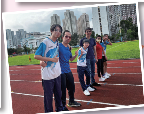
同學可邀請家長或老師參與活動